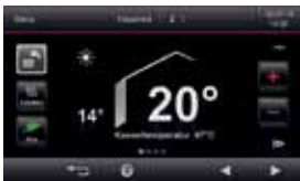
Regulacija Vitotronic 200 s Touch-Display-om u boji