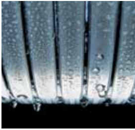
Inox-Radial izmjenjivač topline - dugotrajan i učinkovit